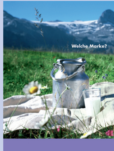
Abb. 2: Kein Key Visual „Lila Kuh“ ist zu sehen und doch erkennen 66 Prozent der Befragten Milka.

In einer repräsentativen deutschlandweiten Studie wurde die Wirksamkeit von Kommunikationsmustern empirisch bewiesen. Die Untersuchung, die seit fast sieben Jahren durchgeführt wird, zeigt auf, welche Elemente ein Kommunikationsmuster wirkungsvoll machen.