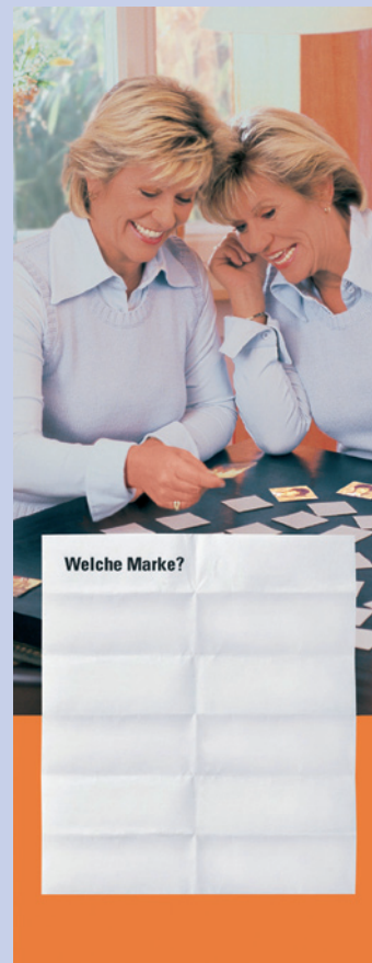
Abb. 4: Treue zu einem Muster lohnt sich: In 2006 wurden bereits 82 Prozent korrekt ratiopharm zugeordnet.