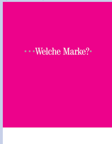
Abb. 6: 86 Prozent richtige Zuordnung: Die überwältigende Mehrheit der Befragten sagt spontan „Telekom“. Die Farbe, aber auch Schrift und die Telekom-„Digits“ sorgen für eine klare Markenbindung der Werbung.

Die richtige Zuordnung einer Werbebotschaft zu ihrem Absender entscheidet über den Erfolg. Basieren Anzeigen, Spots, Web etc. auf einem typischen Kommunikationsmuster, ist die Zuordnung besonders hoch. Dies sollte empirisch überprüft werden. Anhand von Kampagnen aus unterschiedlichen Branchen wurde untersucht, ob und wie stark sich Kommunikationsmuster im Gedächtnis der Konsumenten verankert haben. Dazu wurden den Befragten Anzeigen vorgelegt, auf denen weder Markennamen noch Produktabbildungen zu sehen sind. Anstelle einer Headline standen die Worte „Welche Marke?“. Die Anzeigen wurden zudem in dieser Form zuvor nicht werblich von den Marken eingesetzt, konnten also nicht direkt wiedererkannt werden.