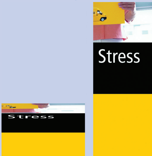
Abb. 5: Trotz aller Störungen und Fremdeinflüsse anzukommen, ist einer Nachricht nur möglich, wenn sie in ein stabiles Muster gepackt ist. Selbst wenn diese Anzeige der Deutsche Post deformiert ist, erkennt man noch, wer spricht.

sind Baumaterial für das Kommunikationsmuster. Für Marken, die bislang über kein kommunikatives Muster verfügen, lautet die Aufgabe, neue, charakteristische Elemente in die Kommunikation einfließen zu lassen.